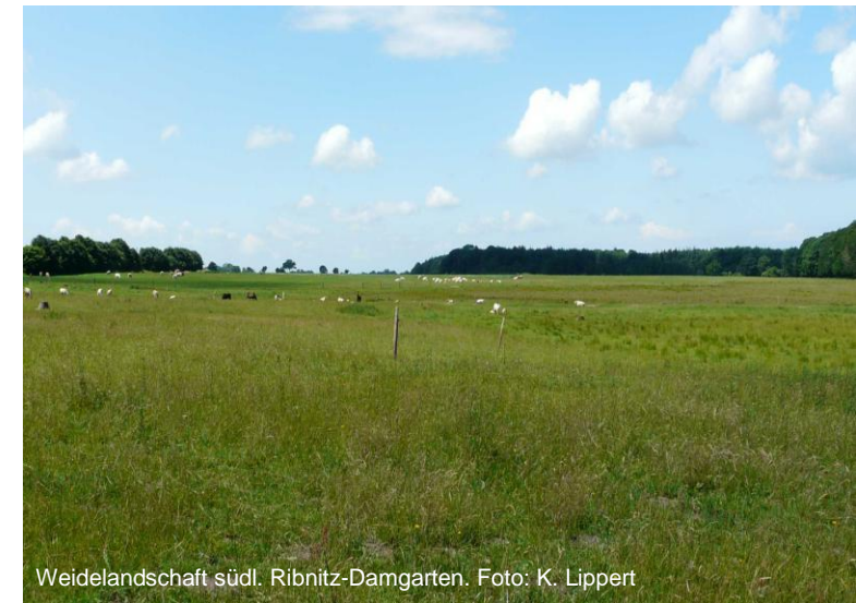
Weidelandschaft südl. Ribnitz-Damgarten.

08. und 09.09.2016 Güstrow / Döberitzer Heide