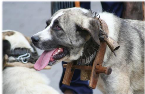
Zum Schutz gegen Wölfe trägt dieser spanische Mastin ein Stachelhalsband