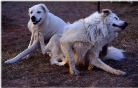
Große weiße Maremmen Hunde bewachen die Schafe in den Abruzzen