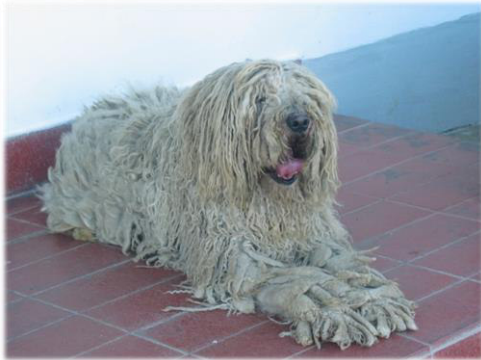
Typisch für den Komondor aus Ungarn ist sein verfilztes Fell